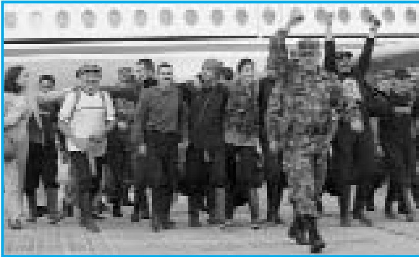
La espectacular operación militar que llevó al rescate de Ingrid Betancourt contada por primera vez por sus protagonistas.